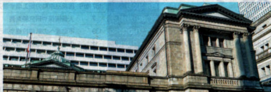
日銀の間接的な株式保有比率が高い主な銘柄（ ■ は日銀が筆頭株主）

8月23日時点での推計で日銀の株式保有比率が最も高いのはミツミ電機（6767）で、14%と事実上の筆頭株主だ。日経平均採用銘柄で最も寄与度が大きいファーストリテイリング（9983）にはETFを通じて4000億円強の資金が流入。事実上の保有比率は11%と柳井正会長兼社長などに次ぐ3位株主。すでに日経平均採用銘柄の約9割にあたる約200で上位10位以内の「大株主」となっている。